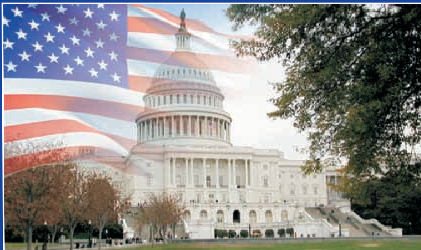
Capitol, Washington - DC, USA.