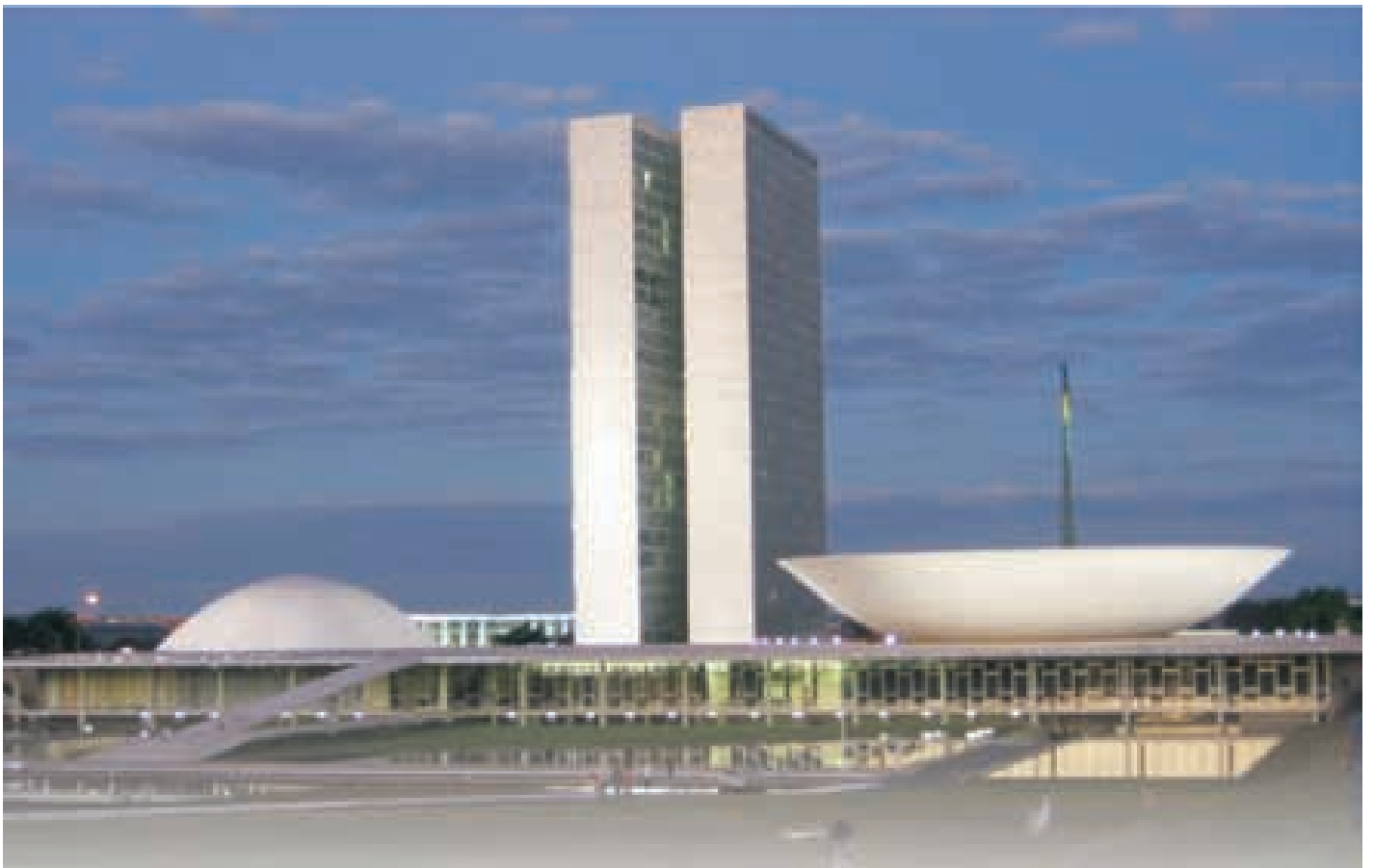
Palácio do Congresso Nacional, Brasília - DF.