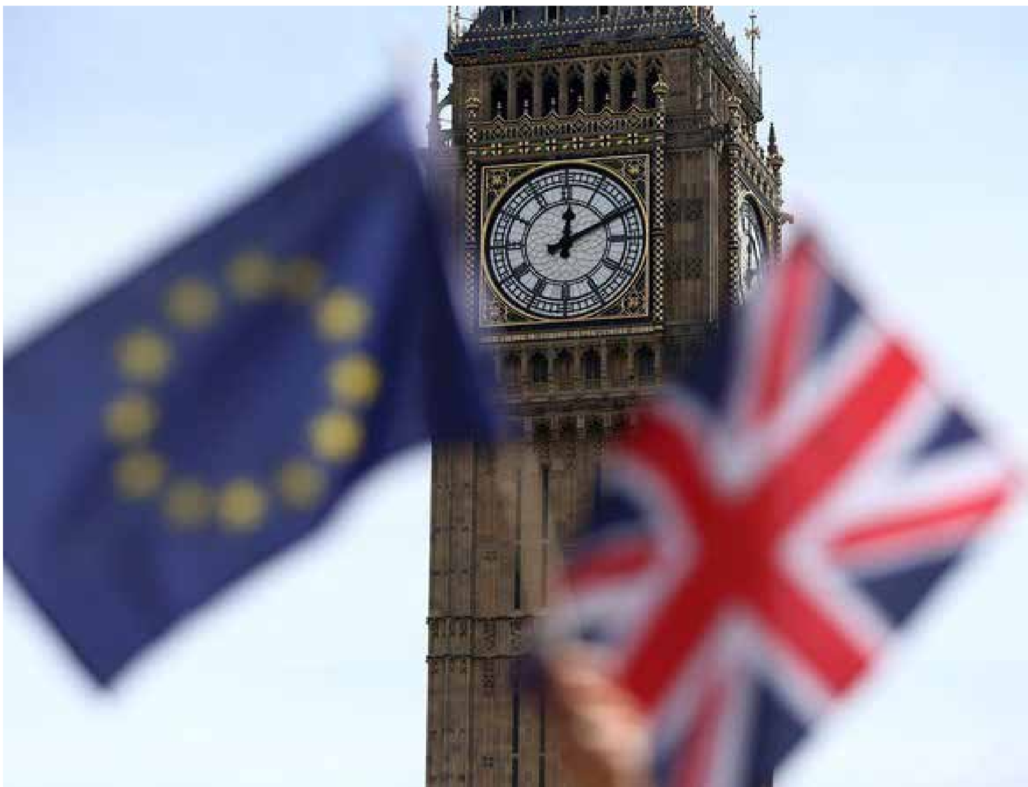
Eleitores britânicos decidem plebiscito se o país continua ou não a integrar a União Europeia