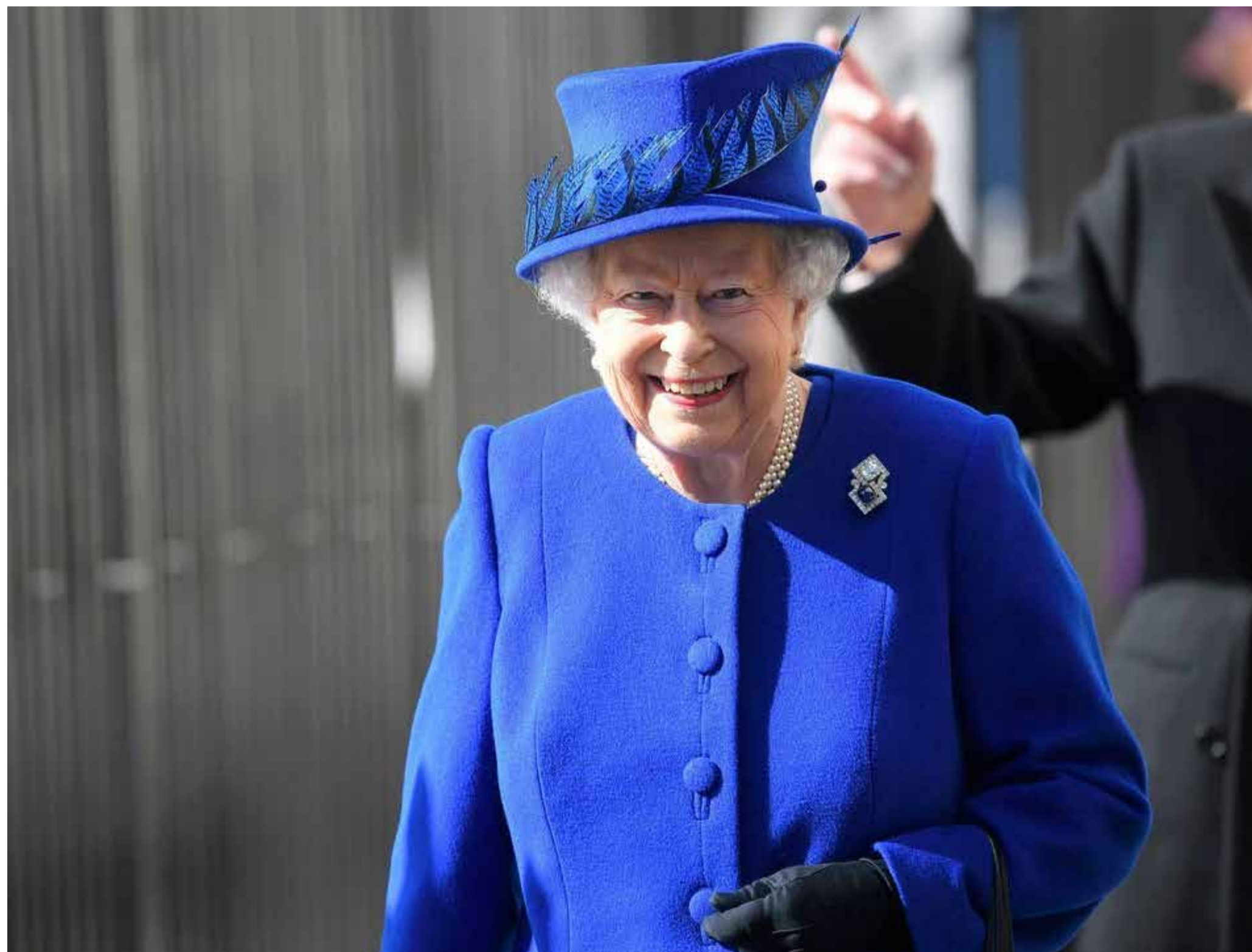
Rainha Elizabeth aprova legislação que autoriza início formal de negociações do Brexit.