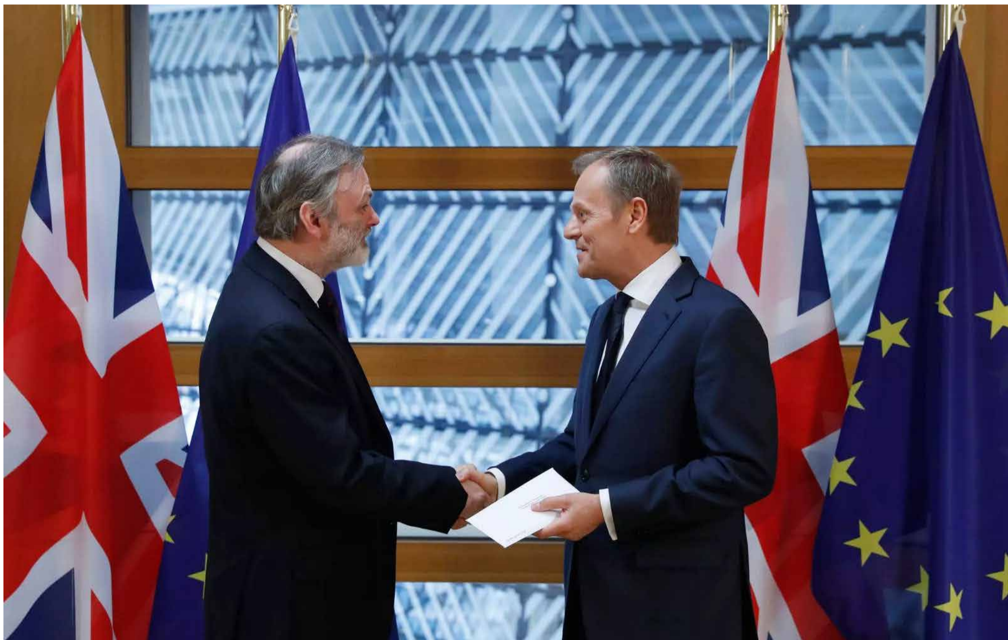
Embaixador britânico na União Europeia, Tim Barrow, entregou carta que inicia a retirada do Reino Unido do bloco ao presidente do Conselho Europeu, Donald Tusk.

Afastamento só acontecerá após ao menos dois anos de negociação com os outros 27 países do bloco. Carta foi entregue ao Conselho Europeu.