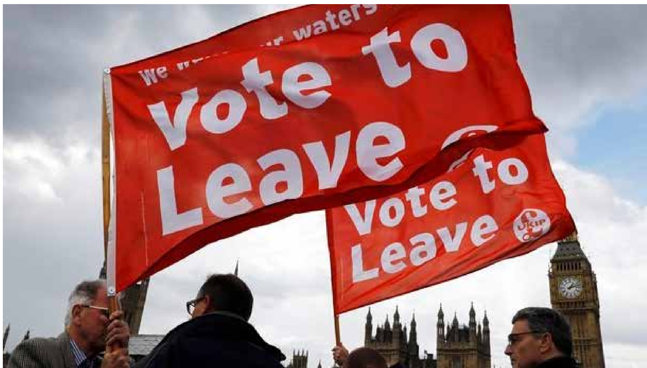
Manifestantes a favor da saída da União Europeia exibem cartazes em Londres.