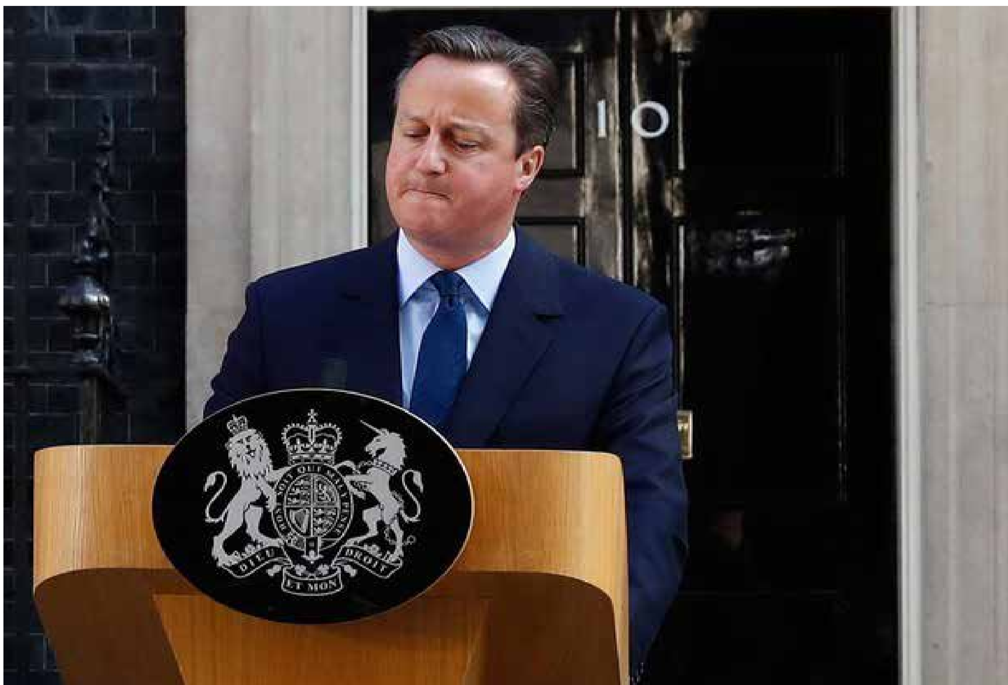
O primeiro-ministro britânico, David Cameron, durante pronunciamento no qual anunciou que vai renunciar.