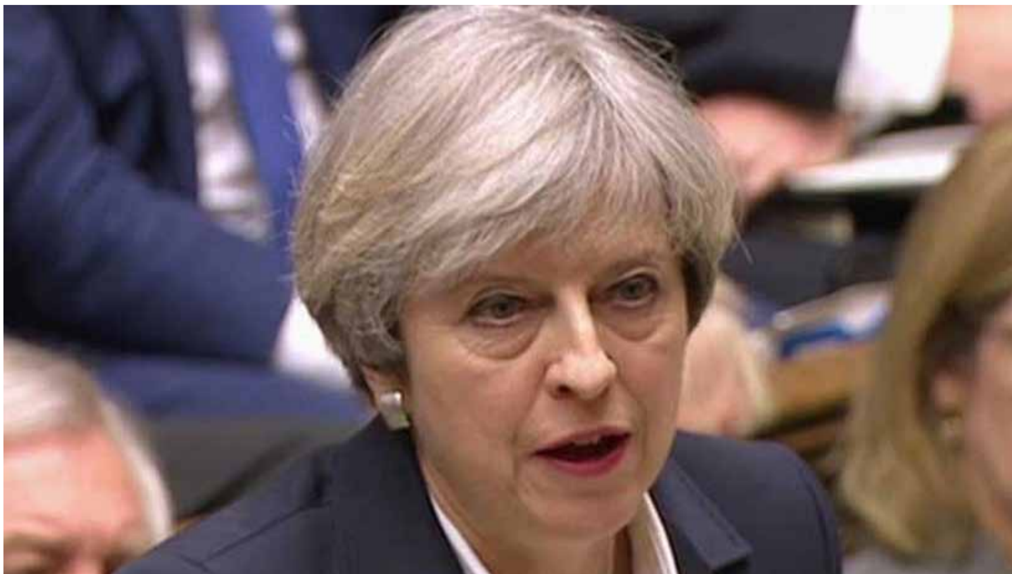
Premiê britânica, Theresa May, faz pronunciamento no Parlamento logo após comunicar à União Europeia a intenção de deixar o bloco.