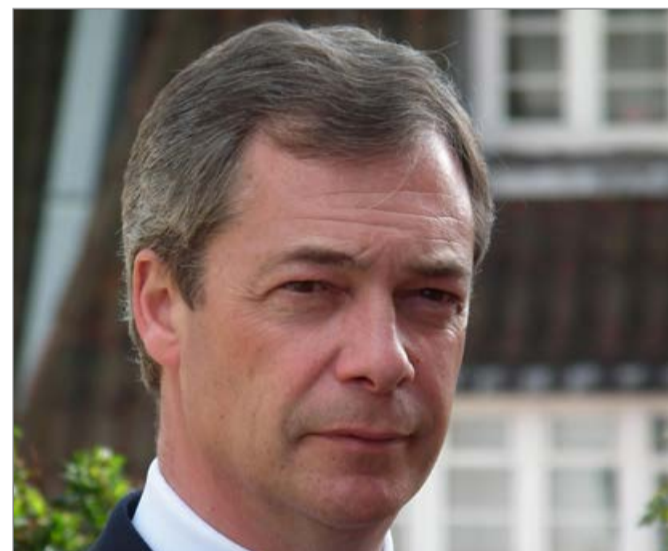
Nigel Farage Partido de Independência do Reino Unido (Ukip) O líder britânico do Brexit janta com o Presidente dos Estados Unidos Donald Trump, em Washington, D.C.