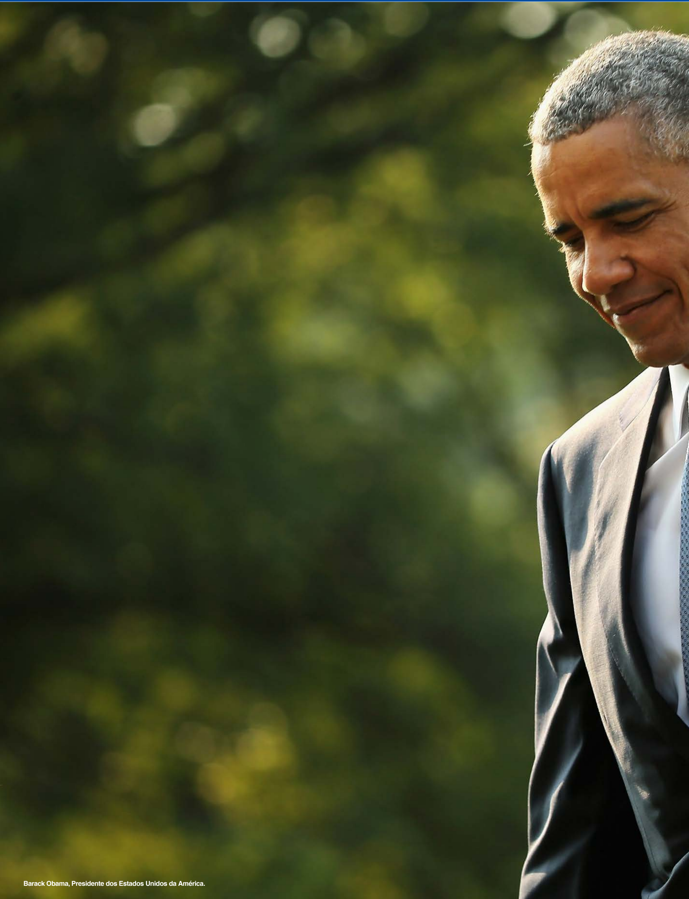
Barack Obama, Presidente dos Estados Unidos da América.