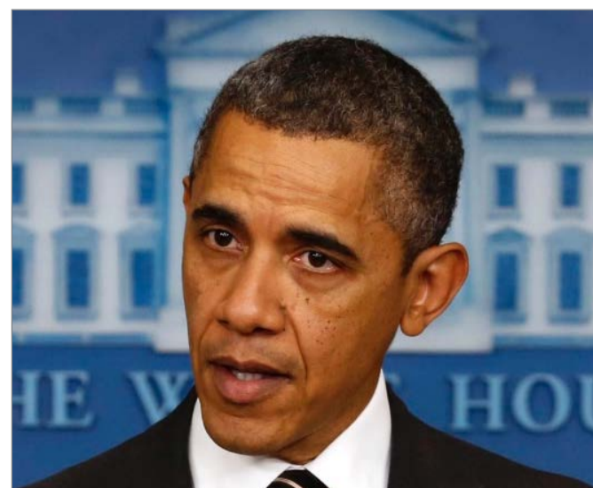
Barack Obama Presidente dos Estados Unidos da América O que o Presidente Barack Obama pode fazer nas poucas semanas que lhe restam na presidência dos EUA?