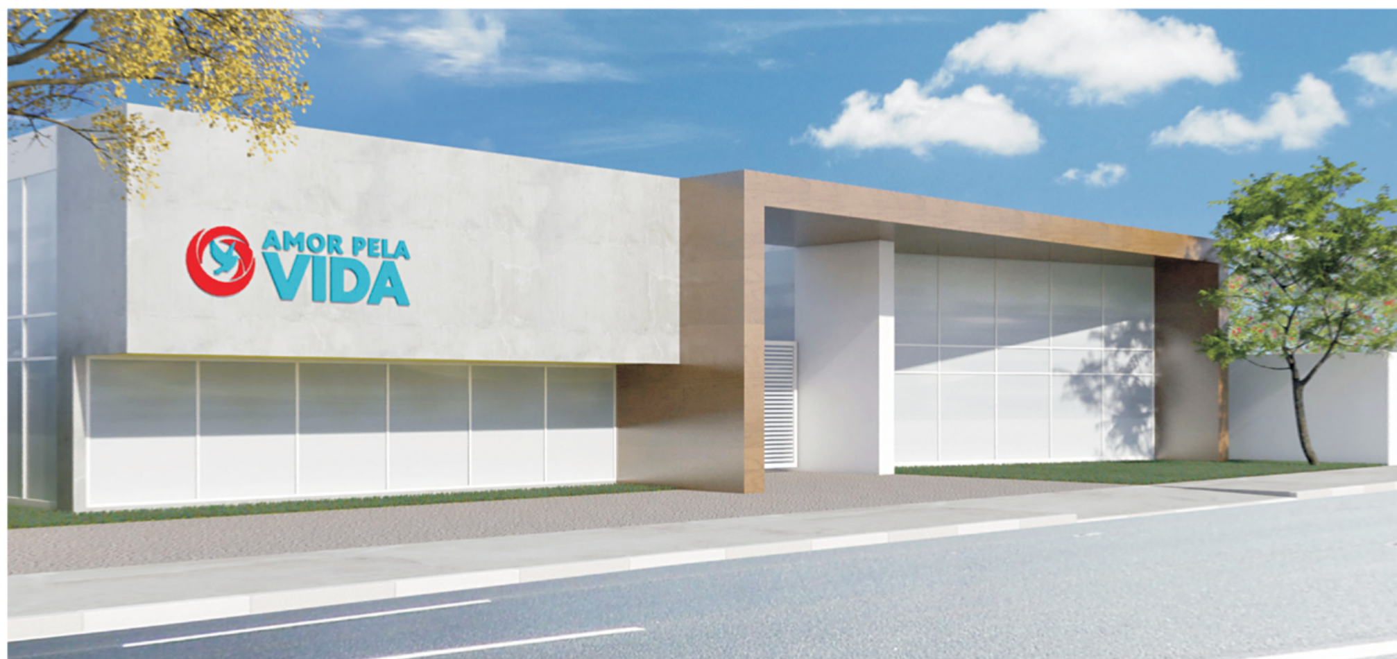
Perspectiva artística da fachada do Centro de Reabilitação e Reinserção Social de Dependentes de Drogas AMOR PELA VIDA, criado pelo IDELB.

Nenhum caminho de flores conduz à glória. Vamos superar os obstáculos com a força de nossa coragem, enfrentando as vicissitudes e dando alento ao povo sofrido, vítima das brutais desigualdades sociais.