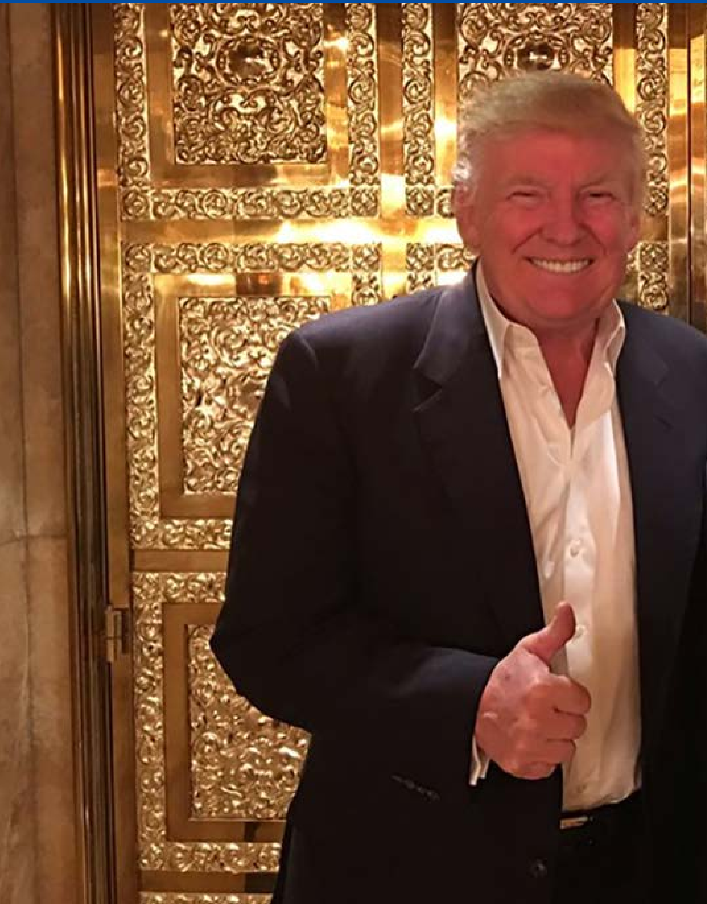
O Presidente dos EUA Donald Trump com o Líder Britânico do Brexit Nigel Farage.