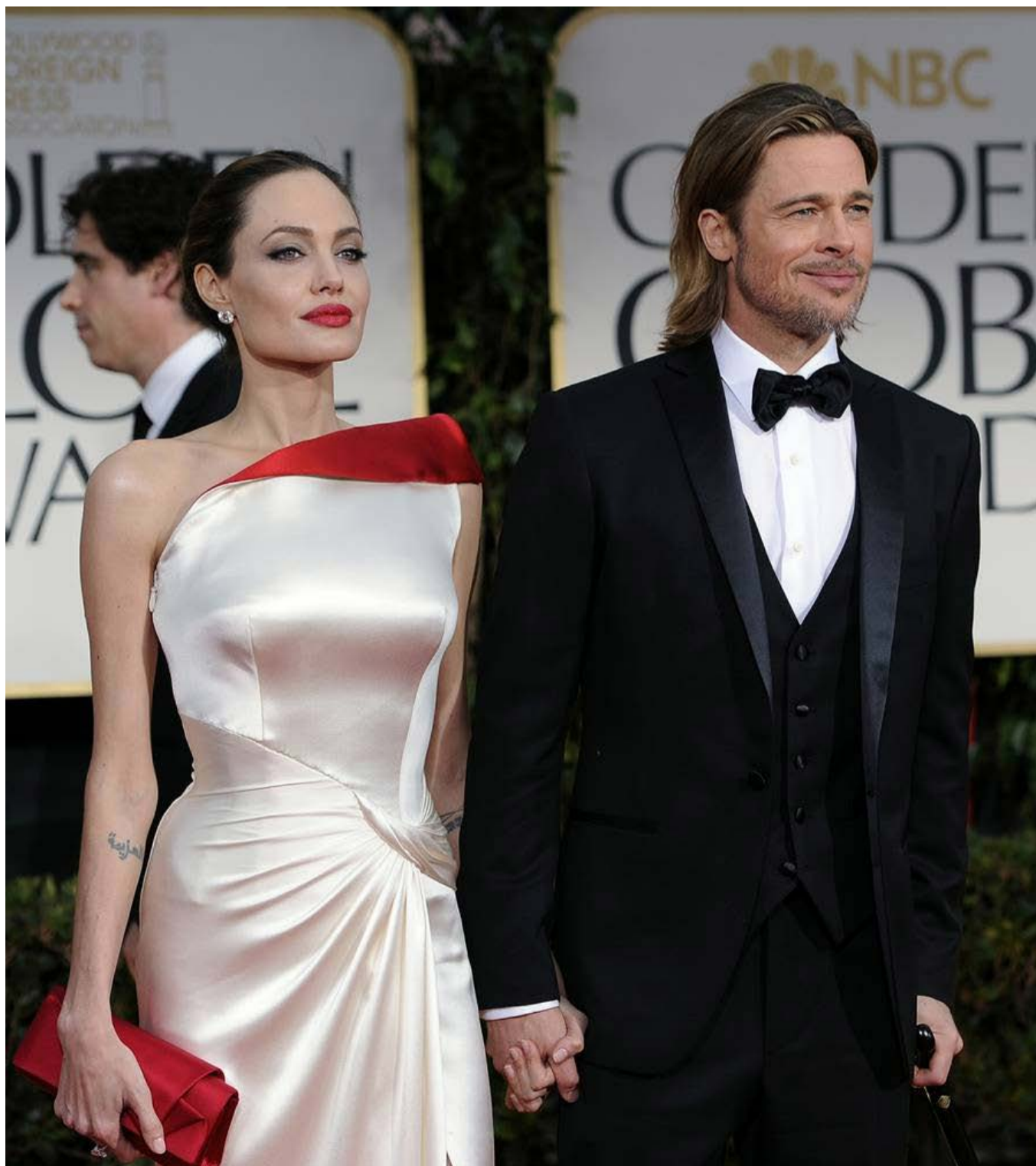
Os atores Angelina Jolie e Brad Pitt.

Depois disso, o casal chegou a um acordo temporário a respeito da custódia dos filhos, até que se chegasse a uma resolução definitiva.