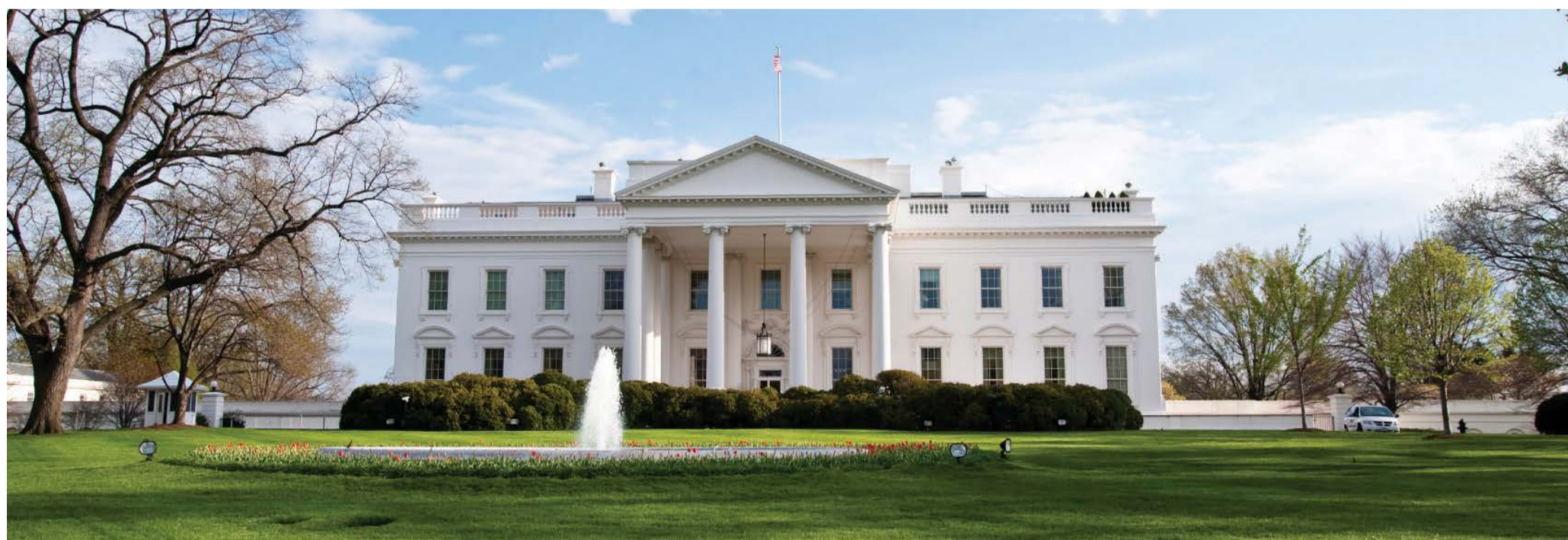
Casa Branca, em Washington, DC.

O atual ambiente político nos ensina que devemos sempre estar esperando surpresas.