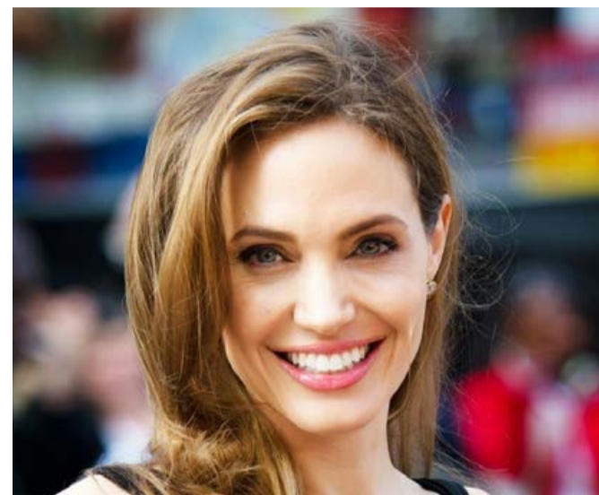
Angelina Jolie Atriz, Cineasta e Ativista Humanitária Americana 'Nós sempre seremos uma família', diz sobre divórcio com Brad Pitt