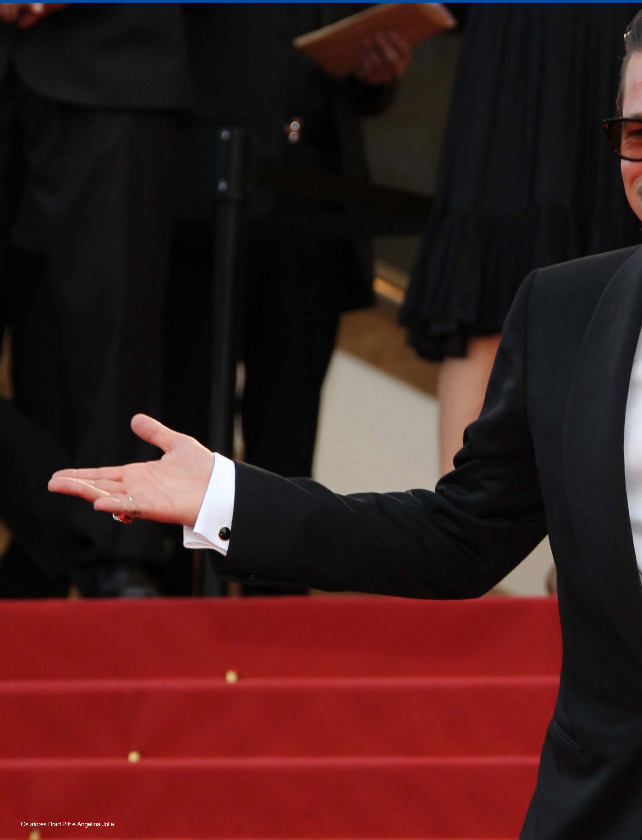
Os atores Brad Pitt e Angelina Jolie.